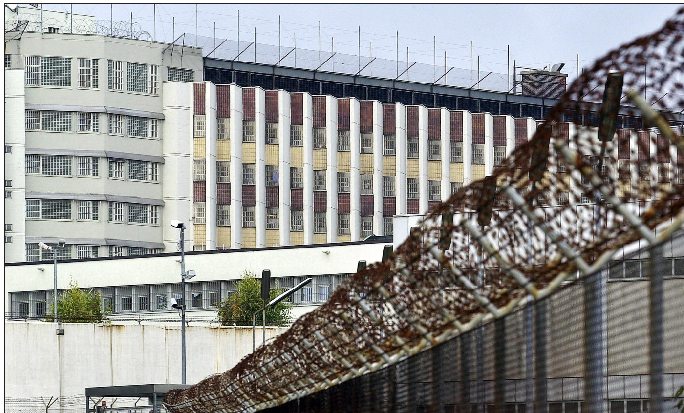
Die Mehrheit der Rottweiler will kein Großgefängnis, wie hier in Stuttgart-Stammheim. Dies ergab unsere TED-Umfrage.

Rottweil. Am Sonntagnachmittag wurde in der Straße Im Kapellenösch ein geparkter VW angefahren. Das Fahrzeug stand zwischen 14.45 und 15.45 Uhr auf einem Parkplatz in der Nähe des Möbelhauses Wohn-Schick. Zeugen werden gebeten, sich unter Telefon 0741/47 71 05 mit dem Polizeirevier Rottweil in Verbindung zu setzen.