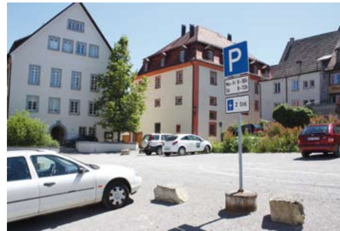
Fast noch ein Geheimtipp: der Übergangsparkplatz auf dem Grundstück der Alten Paketpost.

ROTTWEIL – Parken im Herzen der Stadt? Das ist in Rottweil auch während der Bauphase gut möglich.