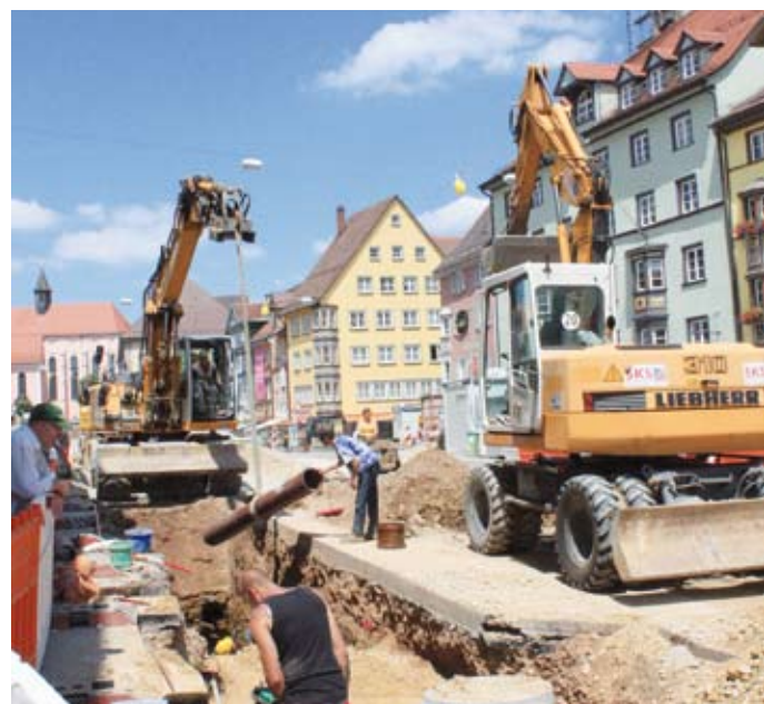
Volles Tempo für „Rottweil Mitte“: Bauarbeiter verlegen in der Hochbrücktorstraße neue Rohre.

ROTTWEIL – Es gibt viel zu tun auf Rottweils größter Straßenbaustelle: Bagger ziehen tiefe Gräben, Bauarbeiter verlegen neue Leitungen. Der Energieversorger ENRW hat bald alle maroden Gasleitungen ausgetauscht. Auch das Wasser- und Abwassernetz sowie die Stromkabel wurden bereits in großen Teilen erneuert. Im August gilt es nun, die Leitungen über die Hochbrücke zu verlegen. Die Brücke und die Hochbrücktorstraße sind daher vom 2. August bis 10. September für den Verkehr voll gesperrt.